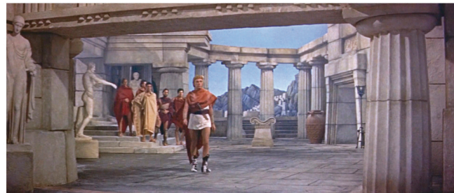
1955 La pícara Molinera , forillo, extensión de pasillo

Su extraordinaria capacidad de artesano de efectos visuales le permitió combinar varias técnicas, como el uso de cristales o chapas pintadas delante de la cámara, así como maquetas corpóreas fijas o móviles. También destacó por insertar maquetas y miniaturas en escenarios naturales.