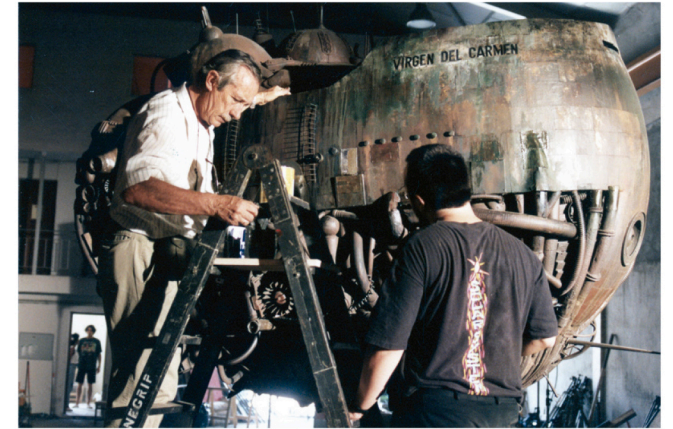
1992 Acción mutante , maqueta de nave espacial Emilio y Alex de la Iglesia