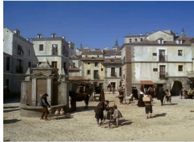
1974 El Pícaro RTVE, maqueta pintada

Es, indudablemente, una de las grandes figuras del cine español: su filmografía está formada por más de 450 películas en las que participó a lo largo de una carrera de casi 65 años. Emilio Ruiz del Río trabajó a las órdenes de los directores más legendarios de la historia del cine y estuvo nominado 10 veces a los Premios Goya, siete de ellas de modo consecutivo.