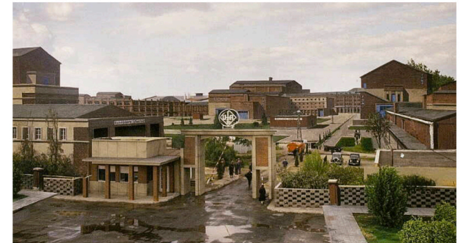
1998 La niña de tus ojos , maqueta pintada

Esta exposición busca mantener vivo el recuerdo de su increíble aportación al cine mundial. La mayoría le descubrirá con asombro; los que le conocieron le recordarán con cariño, y quizá para otros más jóvenes resulte una inspiración. Son los efectos habituales que produce alguien “extraordinario”, otra buena palabra para definir a Emilio Ruiz del Río.