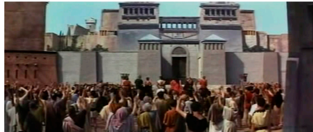
1963 Los 7 Invencibles , maqueta pintada